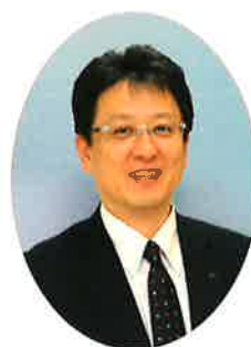
熊本市長 大西 一史