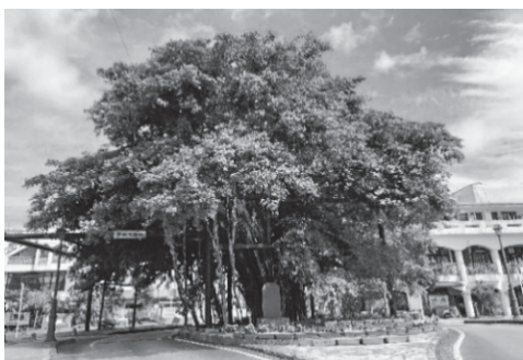
ひんぶんガジュマル

この威風堂々たるガジュマルは、名護市のシンボルとして市民に愛され、また沖縄を訪れる観光客にとっても人気のスポットとなっています。