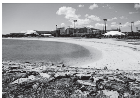
21世紀の森ビーチ (写真提供元：photoAC)

名護市の21世紀の森公園内にある「21世紀の森ビーチ」は、人々に愛される美しいビーチです。白い砂浜と穏やかな波が特徴で、特に小さなお子様連れに人気です。遊泳期間中は、シャワーや更衣室も完備されています。バーベキューエリアでの食事や、美しいサンセットが楽しめるビーチとしても有名。静かな環境で、ビーチヨガなども楽しめます。