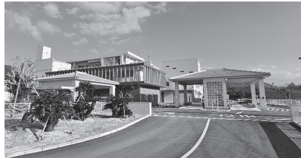
計量棟及び管理棟

加えて、太陽光発電を導入し、照明等の電源として利用することで、省エネルギー化と脱炭素化を推進しています。