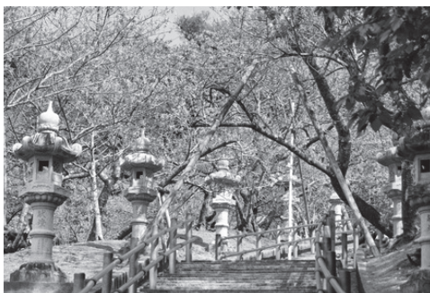
名護中央公園のカンヒザクラ

名護中央公園は「日本さくら名所100選」にも選ばれ、沖縄で最も早い桜を楽しめる絶景スポットです。1月下旬から2月上旬にかけて、カンヒザクラが咲き誇り、東シナ海との美しいコントラストが訪れる観光客の心に残る風景となっています。公園内の桜並木や「さくらの園」、名護城跡へ続く石段など、桜の名所が点在し、毎年1月下旬に開催される「名護さくら祭り」では、桜グッズや桜スイーツも楽しめます。