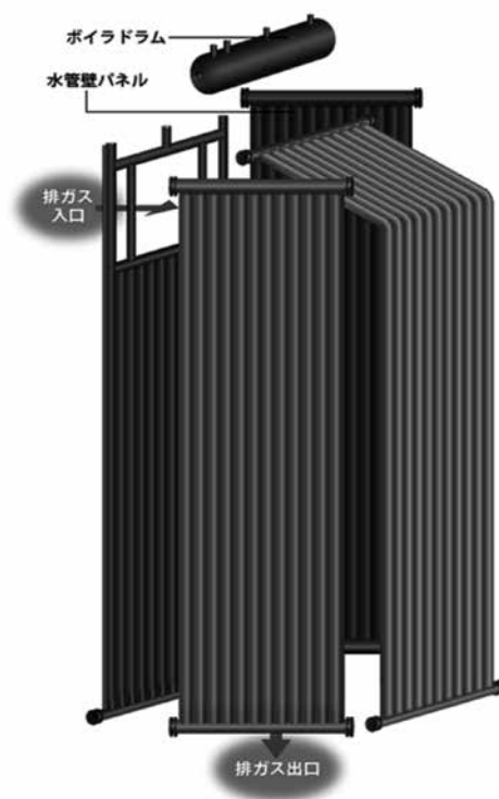
図1 パネルボイラ概略図