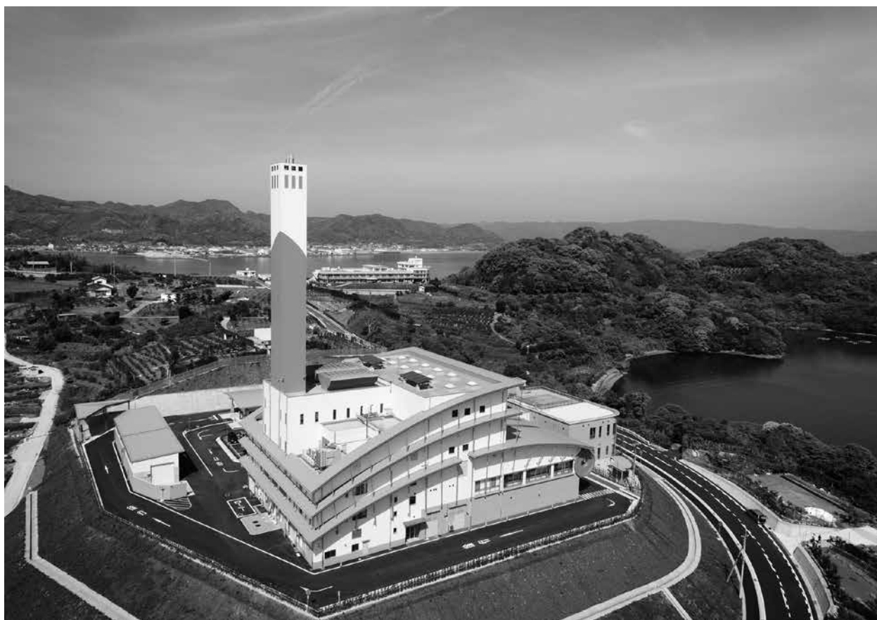
クリーンパーク長与

長与町の主要な産業は農業で、特に200年余の歴史を誇るみかんの産地として有名です。ま