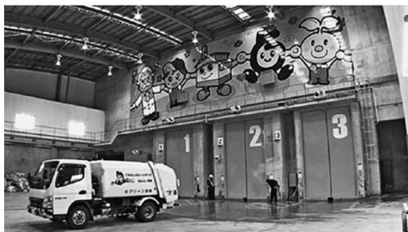
プラットホーム外観

本施設では、一般廃棄物の燃やせるごみ、可燃性粗大ごみと時津クリーンセンターの選別可燃残渣の焼却処理が行われており、独自の堅型ストーカ式焼却炉とSAL（= Super Low Air-ratio）燃焼技術を用いた次世代プラントで低公害・安定燃焼を実現しており、公害防止性能には、国の基準値よりも厳しい自主規制値が設定され、性能試験の全ての項目で自主規制値をはるかに下回る結果が得られています。