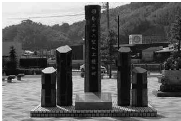
日本 26 聖人上陸記念碑

1597 年 2 月（慶長元年 12 月）、豊臣秀吉の命令により 26 人のカトリック信者が長崎で磔の刑に処され、26 人は後にカトリック教会によって聖人の列に加えられました。この前年、26 聖人殉教の旅（堺から長崎まで）の途中、海路を利用して時津に上陸。一夜を過ごし、殉教地長崎へ向かったことから、時津港に記念碑が建立されています。