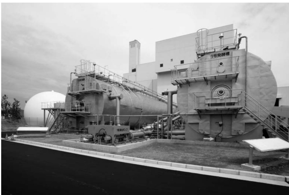
写真2 発酵槽 (工事完了、試運転中)

当社ではこのような強みを活かして「ごみ焼却・バイオガス化複合施設」の普及を図る努力を行うことで、地球温暖化防止や脱炭素社会の実現に貢献できるものと考えている。また、今回取り組んでいる FIT の適用により、当社方式の複合施設の可能性は更に広がると考えており、バイオガスを有効利用できる新しいシステムの構築にも取り組んでいく。