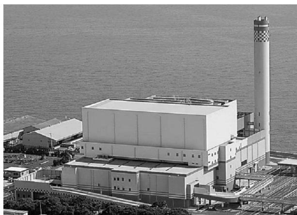
図-2 新門司工場外観

施設の概要を表-1に、設備フローを図-3に示す。溶融炉は、中央上部からコークス・石灰石とともにごみが投入される。ごみは乾燥予熱帯、熱分解・ガス化帯、溶融帯をとおして処理される。熱分解により発生したガスは、燃焼室で完全燃焼され、燃焼排ガスは、廃熱ボイラで熱回収された後急冷、除塵され、触媒反応塔を通過して最終的に煙突より排出される。熱分解後に残った不燃物は溶融帯で完全に溶融される。