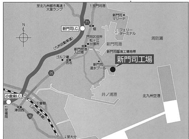
図-1 新門司工場の位置

今回の新門司工場は、北九州市東部に位置し、周防灘に面しており、東は新北九州空港(人工島に2006年3月開港)、北は異国情緒漂う門司港があり、この新門司工場は、門司区及び小倉南区の家庭ごみと一般市民や事業者が直接持ち込む自己搬入ごみの処理を行っている。